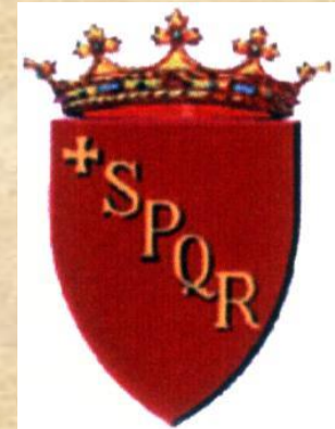
Comune di Roma Municipio V