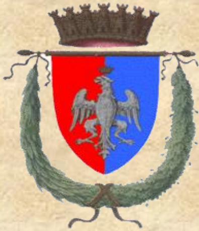
Provincia di Roma